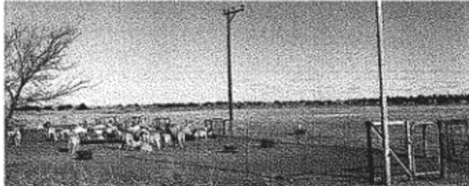
Veediewe in die Vrystaat het in een voorval in Januarie vanjaar tot 109 skape op een slag gesteel.

Die vee word in sulke groot getalle gesteel dat hulle op 'n